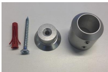
VP3040, väggfäste för stång