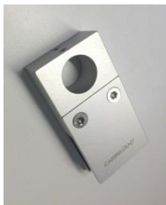
VP7512, ny rektangulär modell

Hållmall för enklare håltagning i vägg. Hörnskydd för att skydda glaset under montering.