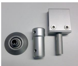
VP6048 VP6050 VP6052